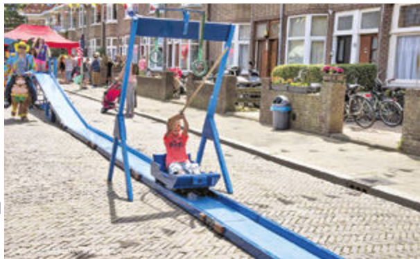
Voorbeeld van een activiteit.