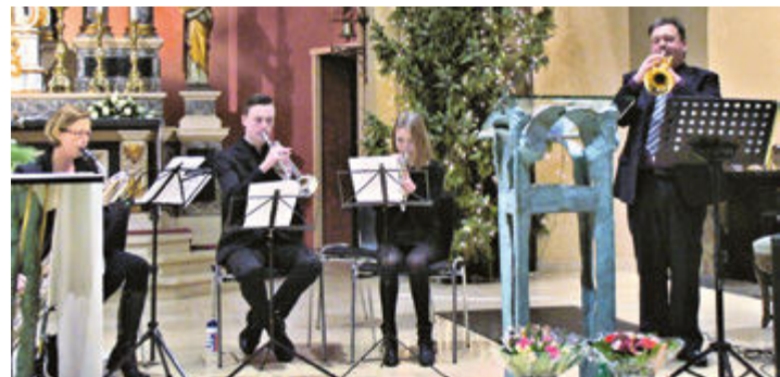
Het Spelthaenkwartet uit Bocholtz dat het lenteconcert van David mee opluistert, tijdens een optreden op het Nieuwjaarscocert van Sobornost in de Simpelveldse parochiekerk.